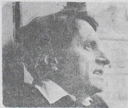
IANNIS XENAKIS (véase p. 31)

— Fuiste muy valiente al lanzarte inicialmente con las formas grandes.