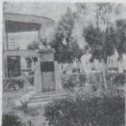
El "zócalo" de Santiago, con el busto del compositor.