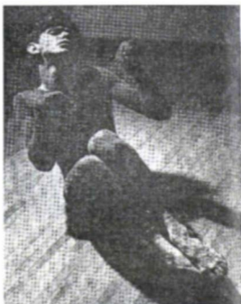
"De un día a otro me convertí en venado". Durante un ensayo de la Balada del venado y la luna, 1949. (Foto: Nacho López).