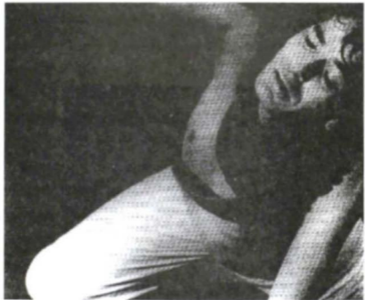
Guillermo Arriaga, congruencia y nacionalismo.