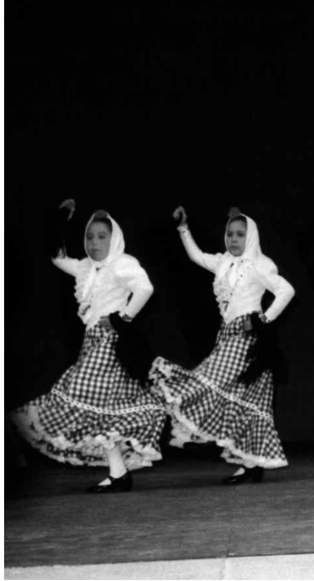
Festivales de Martha Forte. Teatro del Bosque, INBA. México, D.F.