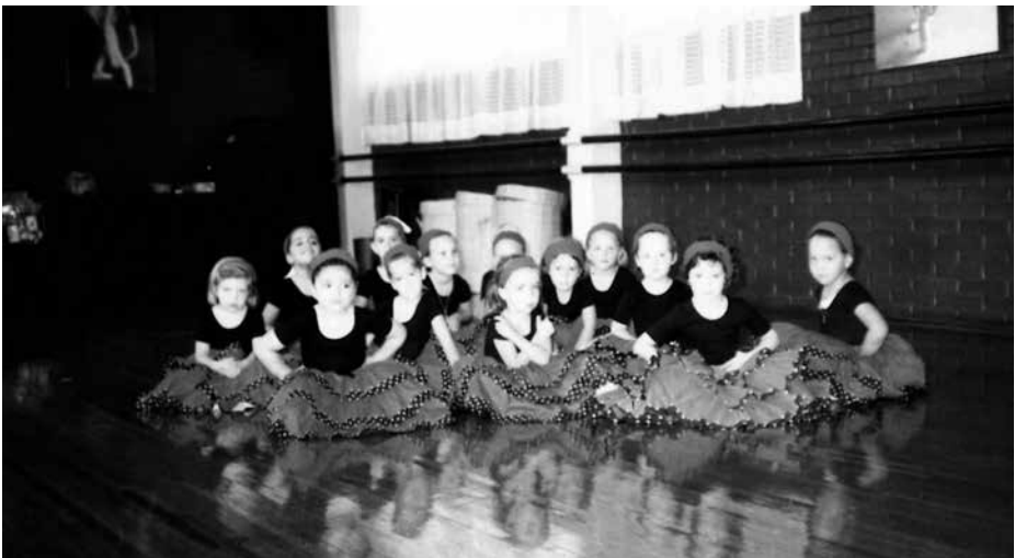
En el salón de clases de danzas españolas de la academia Lomas Ballet Studio. México, D.F.