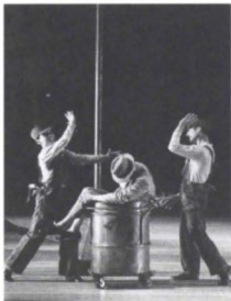
Esquina bajan, Los barrenderos, CND.

lazos de unión entre las imágenes son los escenarios ciudadanos y los transportes que los enlazan. De las locaciones se eligen las cargadas de sentido cultural: el Palacio de Bellas Artes, el Kiosco de Santa María, la Plaza México, las cuales determinan el tipo de actividades que se llevan a cabo alrededor. En cuanto a los transportes, desfila el clásico ¡Esquina, bajan!, los taxis, las bicicletas y carritos de basura, todo lo rodante, que circula y hace circular.