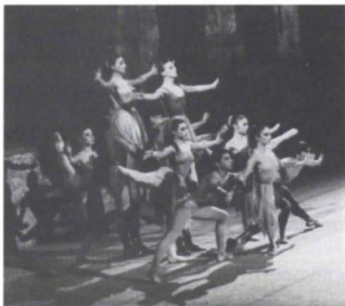
Encuentro , BCM, Grecia, (e. 1968).

todavía no había ido a Egipto y tuve que documentarme ampliamente; para Sansón y Dalila tuve oportunidad de ir a la biblioteca de la Ópera de París para investigar.