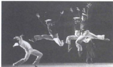
Esquina bajan, los tamarindos, CND.