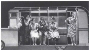
Esquina bajan, camiones, CND.