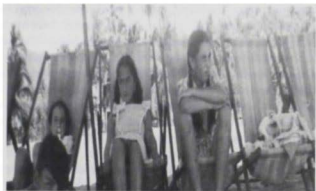
De vacaciones con los primos, (1942).