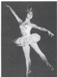
La cenicienta , (1954).