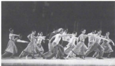
Esquina bajan, CND.