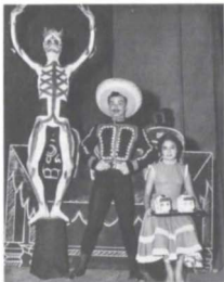
Hapee como vendedora de calaveras en El sueño y la presencia , de Guillermo Arriaga, ADM, (1951)

La compañía oficial de la ADM tuvo varios cambios de nombre y dirección, y sufrió importantes divisiones internas; cada nueva agrupación resultante se consideró parte del INBA, lo que generó mayores dificultades debido a la competencia entre bailarines. Con el advenimiento de las nuevas corrientes ideológicas apareció una nueva postura artística que se unió al nacionalismo y provocó nuevas divisiones: el reconocimiento de la función social de la danza.