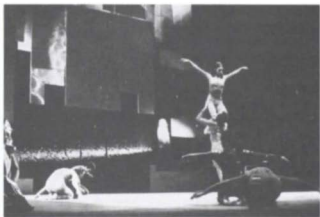
Letanía erótica para la paz, BC 70, (e. 1973).

estructura más abstracta, los bailarines se destacan por la perfección tanto de su técnica como de su anatomía corporal”: “Las evoluciones de los hombres y mujeres en el escenario resultaban de tal hermosura... A su vez el poema, a pesar de su belleza y de su dramaticidad, quedaba rápidamente olvidado ante las notas desgarradoras de la música...”; en la misma reseña se critica a las actrices participantes, quienes parecían estorbar. 54