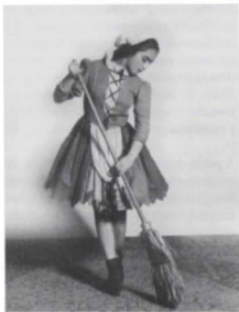
La cenicienta , (1944).

Algunos críticos de la época destacaron las cualidades artísticas de la joven bailarina: “Una pequeña Pavlova si persiste; a su corta edad es una maravilla bailando de puntas. Su figurita grácil giraba llena de ritmo y de gracia” . 7 De sus memorias podemos entresacar la posible razón de su éxito: