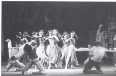
Carmina Burana , CND.

de la sinfonía, fui a la búsqueda de una dinámica distinta, a través de los cambios de direcciones, del uso del torso... traté de encontrar un enriquecimiento.