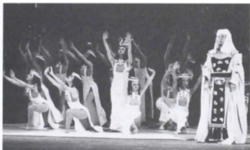
Aída, las sacerdotisas, CND, (e. 1977).