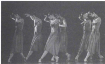
Sinfonía simple , CND, (c. 1977).

vez más Sansón y Dalila , para la Temporada de Ópera y Ballet. 1982 fue un año activo en reposiciones y montajes: realizó la obra Los niños son lluvia de flores preciosas con la END y repuso Aída , Sinfonía simple , La Güera Rodríguez , con la CND. Invitada por el Ballet Nacional de Cuba montó Sinfonía simple , para ser presentada en el Festival de Danza de 1982 en La Habana. También participó como maestra en el Segundo Festival de Danza Contemporánea en San Luis Potosí.