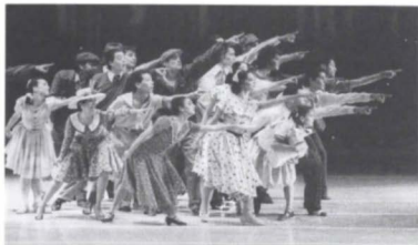
Esquina bajan, carteristas, CND.

diano. Sin quererlo, Fernando Soler, Pedro Infante, Cantinflas, Resortes, Clavillazo y Tin-Tan convivieron dentro de aquéllas; quizá esta atmósfera es uno de los mayores aciertos de la coreografía.