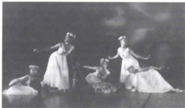
Sueños , Escuela Superior de Música y Danza de Monterrey, (e. 1993).