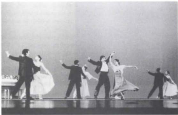
Los Galanes de Rostia , CDG, (e. 1996).

música de danzón compuesta por Arturo Márquez, e hizo las reposiciones de Sansón y Dalila , para el Teatro de Bellas Artes con Plácido Domingo y Bárbara Dever como cantantes (marzo); y de Carmina Burana , que se bailó en los meses de agosto y octubre, también en Bellas Artes. En julio presentó Muñecos con muñecas y Ángeles, ¿angelicales? con la Escuela Superior de Música y Danza de Monterrey, montada durante un curso de coreografía que ella ofreció a maestros de la especialidad.