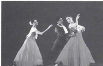
Juventud divino tesoro , ADM, (e. 1999).

del mismo año un merecido reconocimiento a su labor artística.