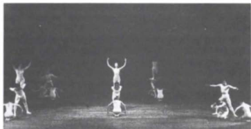
Bachianas , BCM, (e. 1969).

bajo la dirección de Michel Lland. Remontó Encuentro (1963), Trío y Variaciones , y montó Bachianas (1969). Estuvo a punto de montar Ángeles barrocos , pero por dificultades internas, en ausencia de Lland, desistió.