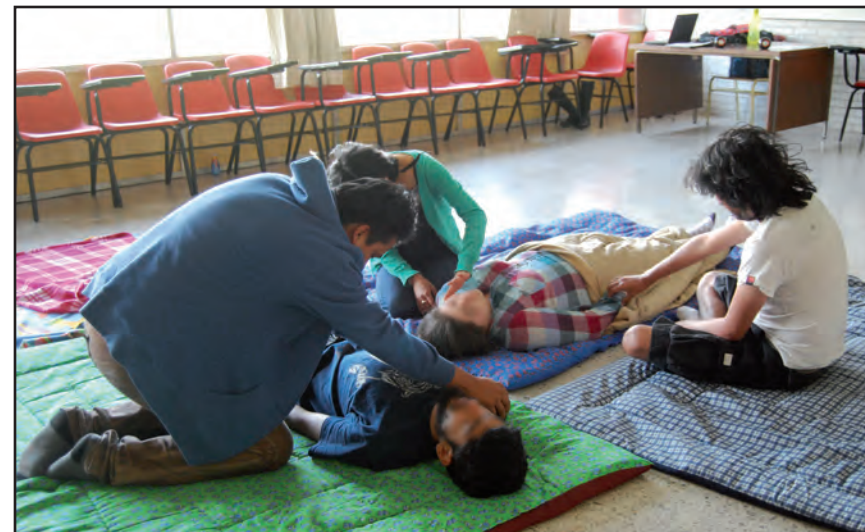
Los enigmas del cuerpo. Taller I, ENAH.

corporal, que incluye de forma contundente la improvisación 61 como una de las herramienta para estimular la creatividad, confieren potencialidades en varias dimensiones 62 interrelacionadas de forma estrecha, y de ninguna manera, ordenadas por sucesión o importancia, pues la urdimbre y complejidad del cuerpo es inmanente e inconmensurable: a nivel somático, otorga alivio a lesiones, corrige posturas corporales o patrones motrices susceptibles de generar deterioros físicos y psicológicos; en otro nivel abre canales afectivos que desembocan en una autorreflexividad y lo que esto conlleva para cada sujeto, por ejemplo, interrogarse sobre la forma de vincularse sin fijar límites y permitirse ser violentado; el último aspecto se refiere al plano de la intersubjetividad, en donde el otro recobra una importancia como semejante, un “como yo” con el que cohabito en el mundo, a quien valoro, y permite que aflore el deseo de ser solidario,