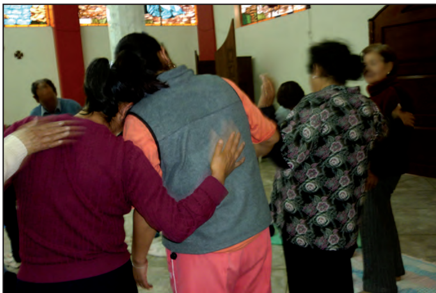
La potencia de “un nosotros”. Taller II San Francisco Culhuacán. Foto: Rocío Hidalgo.*

bitat, sin fisonomía, entre el secreto, la indiferencia y el olvido (Mier, 2008, pp. 55-56).