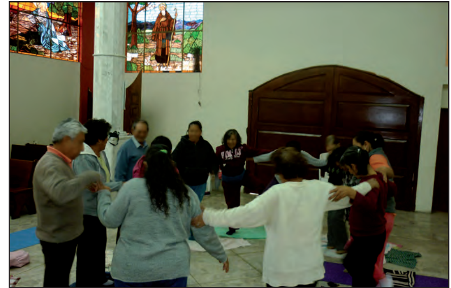
El compromiso como deseo. Taller II San Francisco Culhuacán.

los programas que se imparten con la técnica EMS, ya que el principio fundamental de su ejercicio es el tacto (tipos de toques). La interacción cercana de los sujetos en las diferentes dinámicas que se realizan en las sesiones, de acuerdo con la lógica establecida (terapéutica, formativa, investigación, entrenamiento), es esencial; no obstante, y ante la situación imperante, los procesos pedagógicos y terapéuticos continuaron realizándose bajo las restricciones propias del trabajo en línea, a distancia. Bajo este contexto, es importante ubicar el desenvolvimiento de la emergencia de salud, ya que, como se dijo antes, afectó varios ámbitos de la existencia —si no es que todos—, incluido el emocional, individual y colectivo.