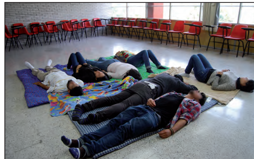
Urdimbres insospechadas. Taller I, ENAH.

Ciertamente, existen metáforas que el uso cotidiano ha desgastado y banalizado, otras que continúan aportando su potencia de sentido y las que se producen en devenir. Las figuras retóricas incitan a la reflexión, proporcionan conocimiento con texturas distintas a las convencionales en una comunicación llana, lo que potencia los horizontes de sentido, es decir, su multivocidad, que se conjuga con las circunstancias experienciales del sujeto. La eficacia no está en el reconocimiento o nominación de las figuras retóricas, sino en la trama que se origina en lo experiencial, en lo corporeizado en conjunción con su despliegue estético, es ahí en donde se desempeñan y cobran sentido para el individuo.