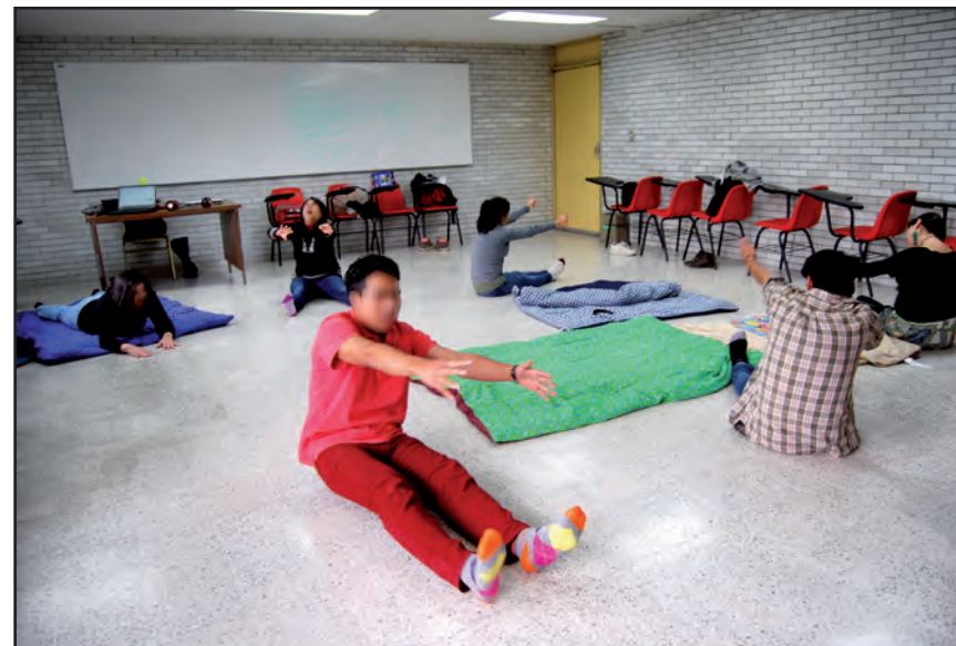
Deseos. Taller I, ENAH.

do con esto, trabajar los patrones de desarrollo motriz estimula de forma insólita la autorreflexividad, generadora de conciencia, para reconocer esas pasiones tristes que pueden estar deteniendo el empeño del ser actuante; el cuerpo abastece a la mente o alma con las imágenes experienciales y esta, a su vez, al cuerpo en sus afecciones 104 y deseos para llevarlos a la acción; es decir, ambas dimensiones son una sola: el ser. “El cuerpo humano existe tal como lo sentimos” (Spinoza, 2014, p. 143) y refleja el pensamiento o alma; la capacidad de acción del individuo lo distingue de los demás, según el autor, y si esta capacidad se ve mermada