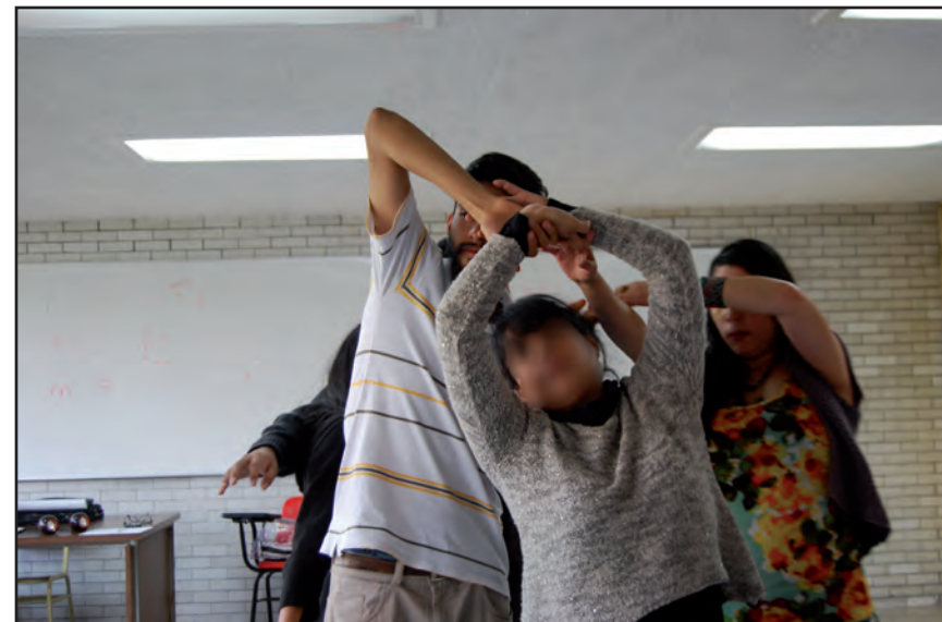
Lo político: el gesto corporal. Taller I, ENAH.

Parte de esta responsabilidad incluye la creatividad para sortear los límites impuestos e incidir en el contexto de adscripción –elegido, impuesto y circunstancial– en el grupo o los grupos de los que forma parte el sujeto. Esta pretensión creará resonancia en tiempo y espacio, así, las significaciones colectivas se transmutan, se resignifican y se yuxtaponen de forma generacional. Comenzar por lo inmediato, “abandonando los hábitos”, por lo más íntimo, que es el propio cuerpo, posibilitará la generación-restauración de modalidades del vínculo, en donde evidentemente estará el otro nítidamente y no como espectro.