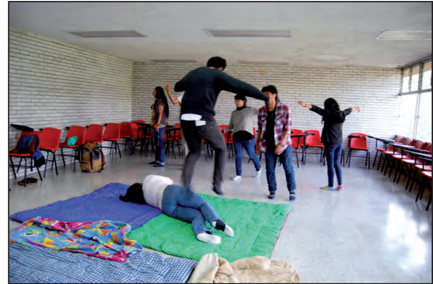
Lo sublime. Taller I, ENAH.

El colectivo expone la potencia de las identidades y una rara y peculiar forma de percibir el cuerpo que puede ser inédita; en ocasiones, establece una familiaridad sobre la concepción y usos del cuerpo que de forma gradual se va creando o describiendo ante la tiranía de las tradiciones, ante, por ejemplo, la norma clasificatoria impuesta por género o edad.