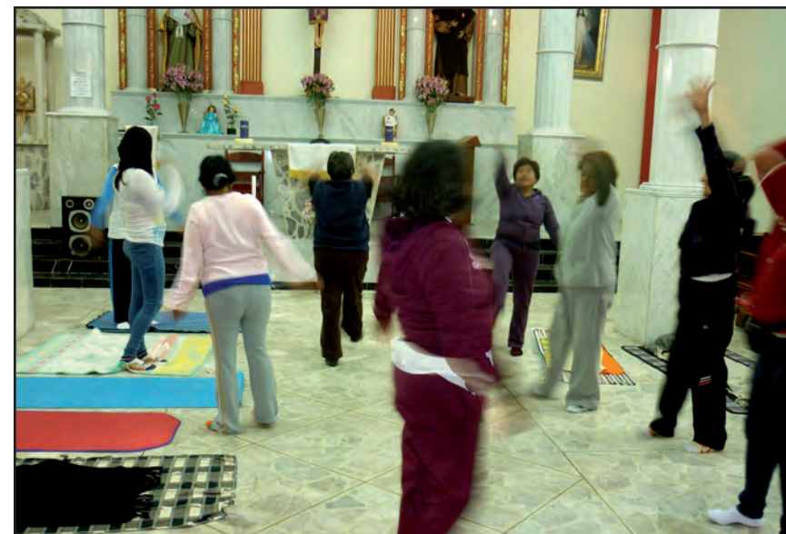
Singularidad y alteridad. Taller II, San Francisco Culhuacán.

la alegría nos lleva en conjunto al deseo de actuar en consecuencia; se trata de la voluntad de hacer el bien como precepto de lo político.