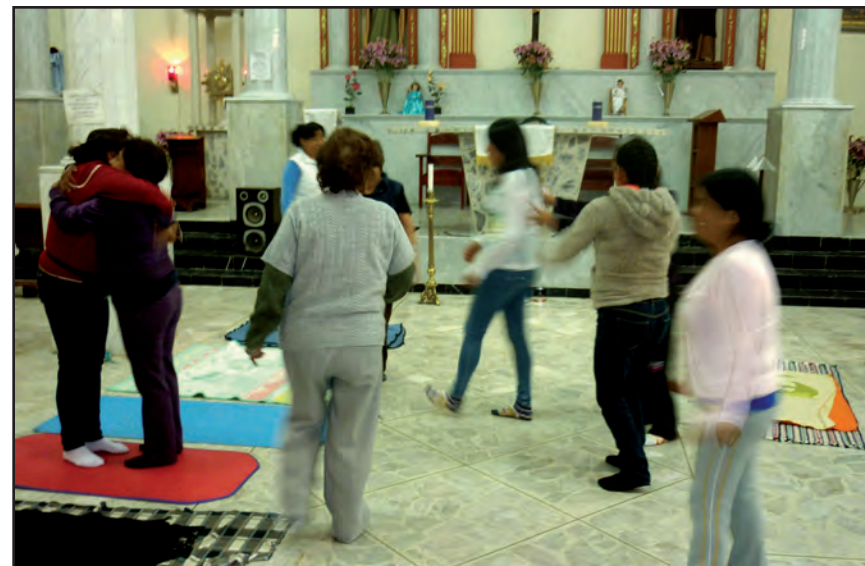
Resonancias. Taller II, San Francisco Culhuacán.

La experiencia estética rebasa la palabra, pero también se realiza en ella, en su condición de advenimiento de ese otro. En este establecimiento del vínculo se funda un espacio y tiempo peculiar, se expanden para vivirse en el cuerpo, en sus segmentos, en sus capas, en lo ínfimo y en lo supremo, en la vibración del cuerpo propio y en el del otro. El cuerpo se funde con el otro en la totalidad y a la vez se singulariza, en este movimiento se reconocen, significan o resignifican valores sociales.