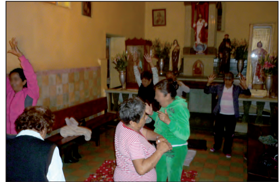
La prolongación de un yo para ustedes, para nosotros, para mí. Taller II, San Francisco Culhuacán.

síntesis posibilita que se construyan expectativas sobre el otro, en su presencia o en su ausencia.