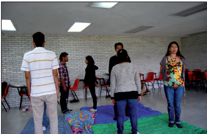
Cartografía del dolor. Taller I, ENAH.

narios, como se observa en los códigos y en diferentes inscripciones en edificaciones arquitectónicas; algunas culturas también les concedían el poder de engendrar las emociones. En el hígado se aloja la ira, en el estómago, la ansiedad, y en el corazón, la felicidad o su contraparte. En esta sesión de un taller presencial fue propicia una contención grupal de tipo corporal y verbal para que la participante desahogara sus emociones, lo que mostró la cualidad armónica que se logró construir en un espacio ritualizado, con estrategias colectivas, gestionadas en el momento, pero configuradas con el material de respuesta afectiva adquirido durante el proceso.