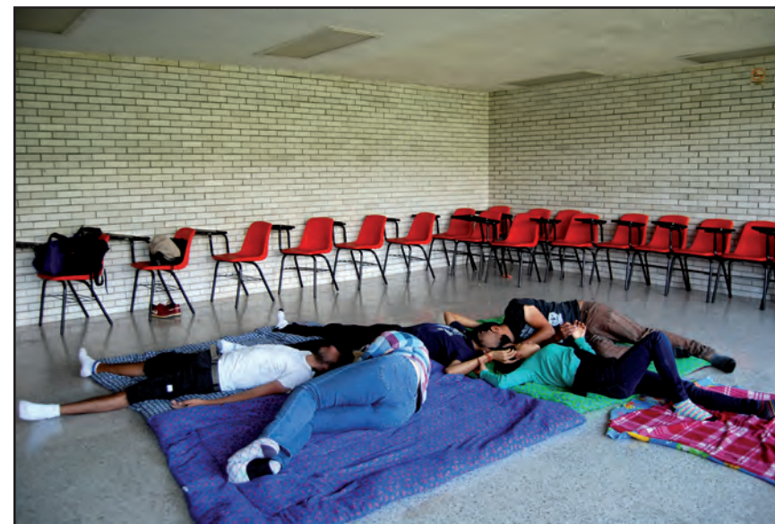
En la interrogación de “un yo”. Taller I, ENAH.

amplio espectro de normas, de la mayoría no se es consciente, se les reproduce en función de una convivencia, y también se infringen, lo que genera problemas sociales en diferentes grados, como se mencionó en los primeros apartados.