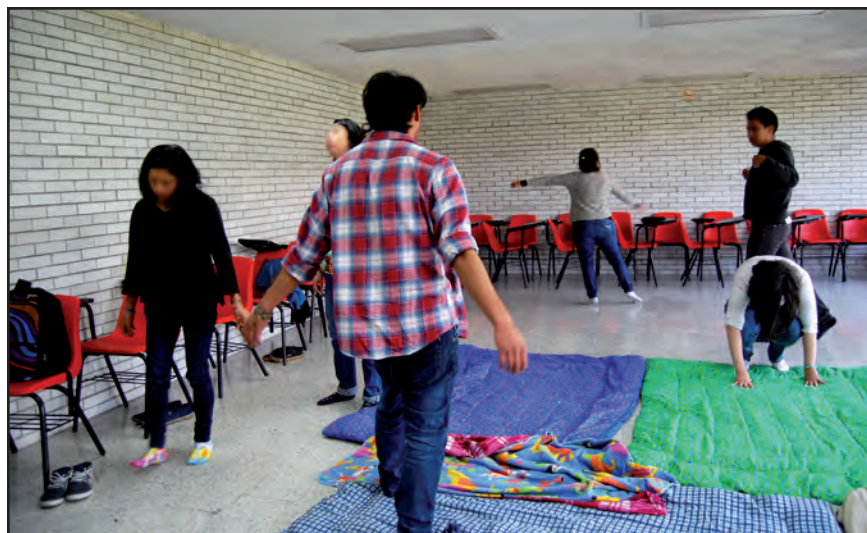
El cuerpo-memoria. Taller I, ENAH.

Del espacio físico delimitado derivó una serie de experiencias, pero también del expandido, el virtual-memorial o proyectivo, que abarcaba cualquier lugar vivenciado por los participantes, y que de la misma manera recogían; a partir de ellos generaban momentos reflexivos. La memoria de sus cuerpos congregaba en el espacio “físico” la oportunidad de “explicarse y cuestionarse” sobre sí y el modo de mirar el mundo: “ver y conocer y tocar a las personas de otra forma. Creo que a veces fluíamos y éramos nosotros mismos, podíamos expresarnos como éramos o lo intentábamos porque a veces uno no expresa lo que siente” (Taller ENAH-7, comunicación personal, noviembre de 2016).