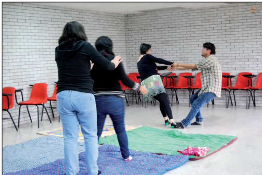
Luminiscencia. Taller I, ENAH.

suscita en las modalidades del vínculo: estrechar lazos de amistad, complicidades o empatías, por ejemplo, es decir, estimula una atmósfera del “estar juntos”.