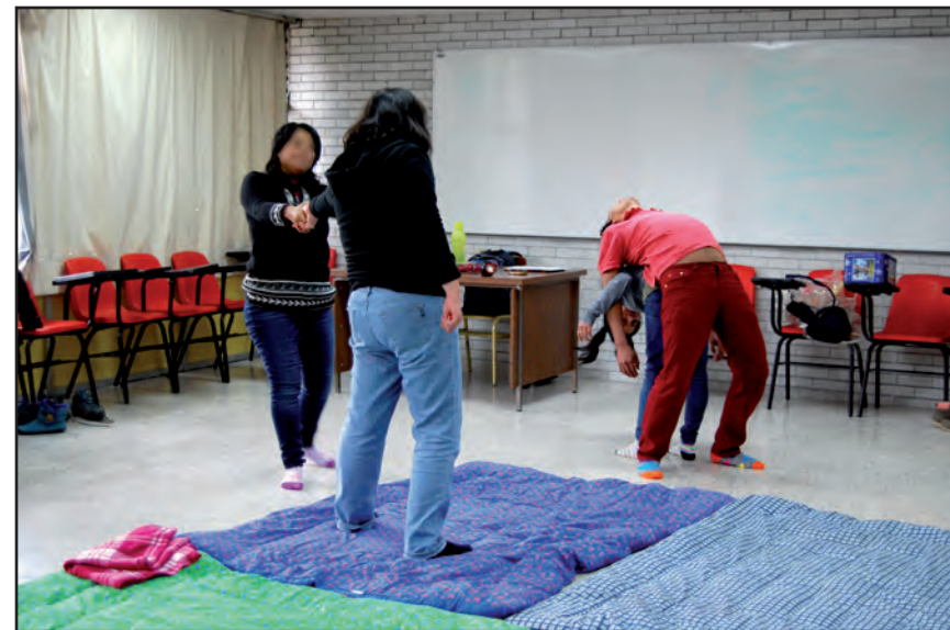
Osadías alegres. Taller I, ENAH.

nera— como en movimiento, en donde se realizan con diferentes partes del cuerpo y cuyo destino es cualquier lugar de él, lo que enriquece las sensaciones. Consiste en un continuo diálogo con el otro y con el propio cuerpo, aun cuando no se esté recibiendo el toque o incluso si se trata de un autotoque.