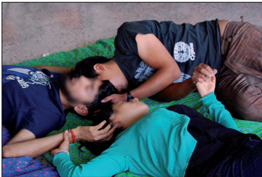
La experiencia de sentir al “otro” como un yo. Taller I ENAH.

janza; se moviliza de acuerdo con situaciones y circunstancias. En ello están las identidades reconocidas, como la ubicación propia del sujeto; las permanentes, es decir, los rasgos más duraderos; y las contingentes o las que se abocan a las identificaciones momentáneas, así como las que el otro u otros le adjudican.