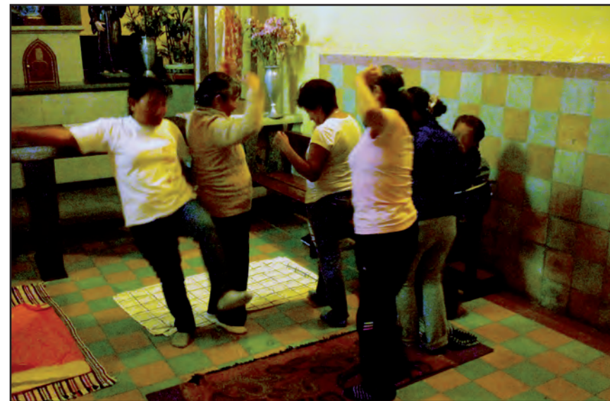
Regocijo expandido. Taller II, San Francisco Culhuacán.

rimenta al otro semejante en su potencialidad, en lo expansivo, rasgo armónico o discordante de lo estético.