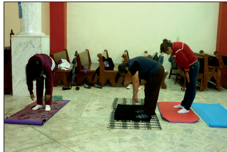
Memorias emanadas. Taller II, San Francisco Culhuacán.

Por su parte, el patrón de vibración está, generalmente, por debajo de nuestra percepción consciente, presente en cada ser viviente de todo el universo, ya que es un atributo de lo existente. En las relaciones interpersonales atrae o aleja; es energía que fluye a partir de ondas. Este patrón, mediante la sonorización, cons-