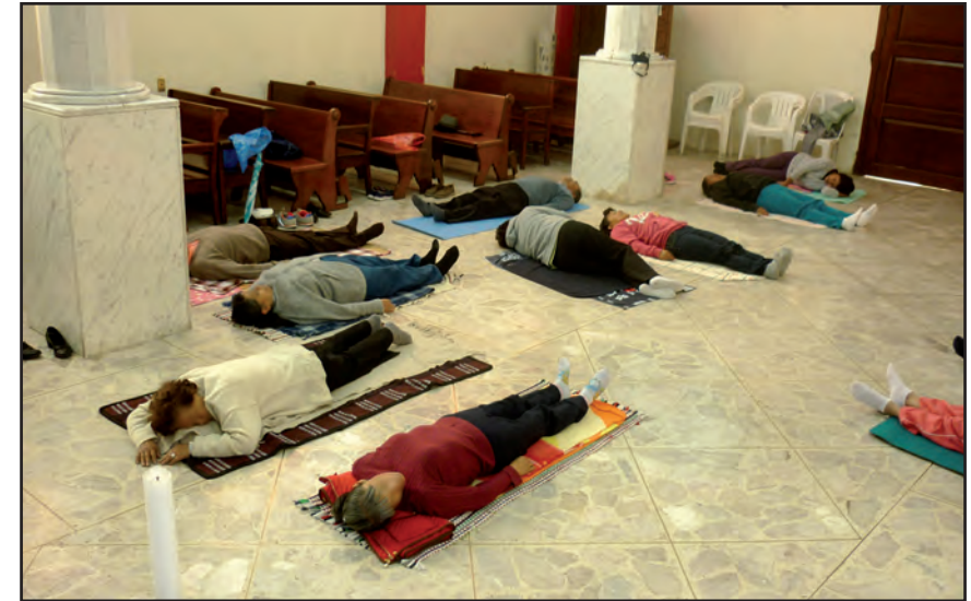
En disposición. Lo profundo del ser. Taller II, San Francisco Culhuacán.

En las zonas de los barrios urbanizados dentro de la ciudad, cuya nominación tiene que ver con el arraigo a una práctica tradicional, a veces ancestral, se desarrollan rituales que se rigen bajo lineamientos estrictos. En el caso de la conformación del espacio en el taller, en donde se promueve una experiencia de intercambio, solidaridad, recreación de identidades colectivas, es propicio manifestar esto como ritualización para diferenciarlo de la noción de ritual por sus diferencias conceptuales, así como caracterizar los relieves de cada uno de acuerdo con la pragmática social que se detallará a continuación.