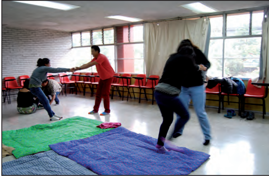
Vínculos, agencia de lo político. Taller I, ENAH.