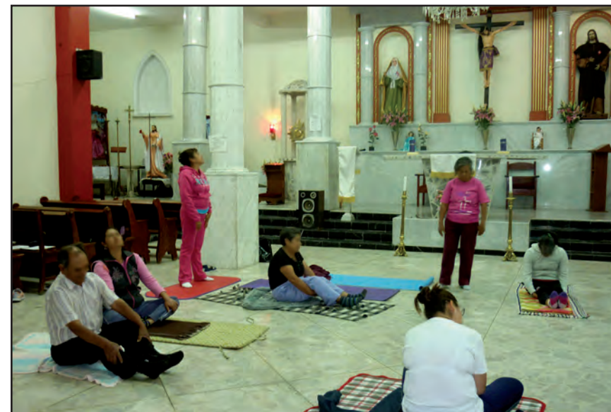
Lo simbólico se “hace” cuerpo. Taller II, San Francisco Culhuacán.

espiritual en este espacio sagrado, por el locus en sí. En las primeras sesiones, los participantes no relacionaban la práctica corporal con su sentido de vínculo social, pero al avanzar el programa se fue revelando para ellos este nexo.