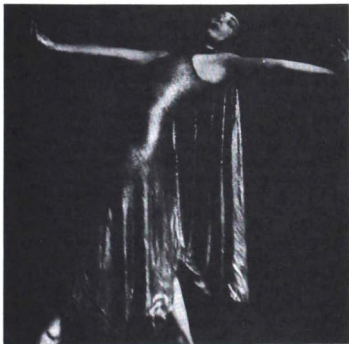
In the Sign of Darkness

¿Qué es Mary Wigman?, se preguntan los que están sinceramente intrigados y los que gritan su hostilidad. Y es legítimo hacerse esta pregunta. ¿Qué tiene la danza de Mary Wigman de contribución a un arte tan antiguo como el hombre para que nos haya parecido tan extraña? Es más fácil preguntar que responder. Los críticos alemanes que lo han intentado se han limitado a las frases elogiosas.