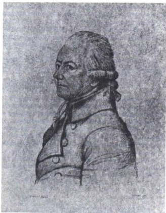
Jean George Noverre