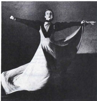
Whit my red fires