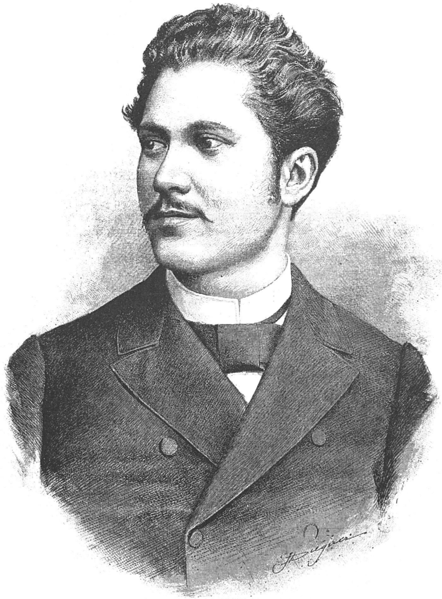
BENIGNO DE LA TORRE

Primera plana de La Ilustración Musical Hispano-Americana , vol. 3, no. 62, Barcelona, 15 de agosto de 1890 (p. 309).