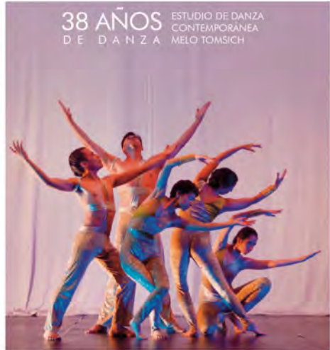
Cartel de aniversario