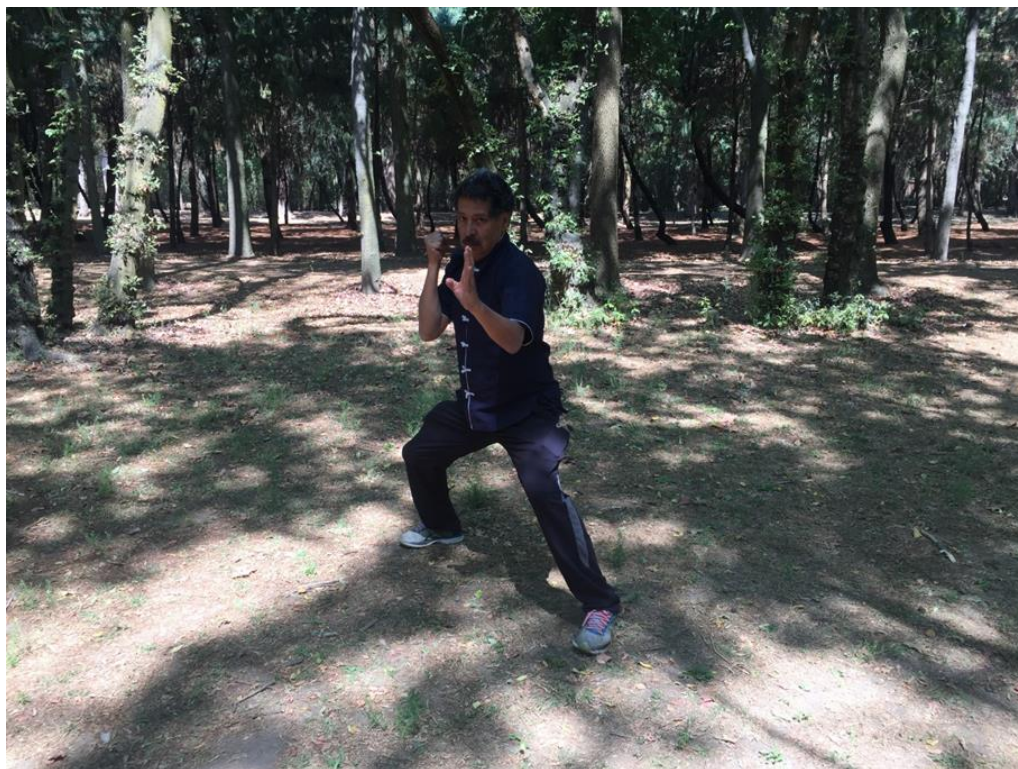
Postura de Du Li Bu