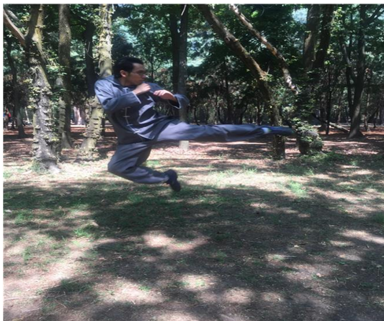
Postura de Du Li Bu