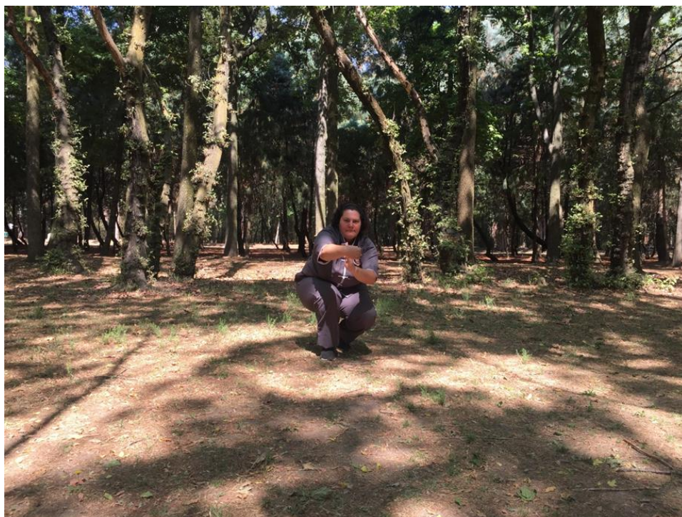
Postura de Pu Bu