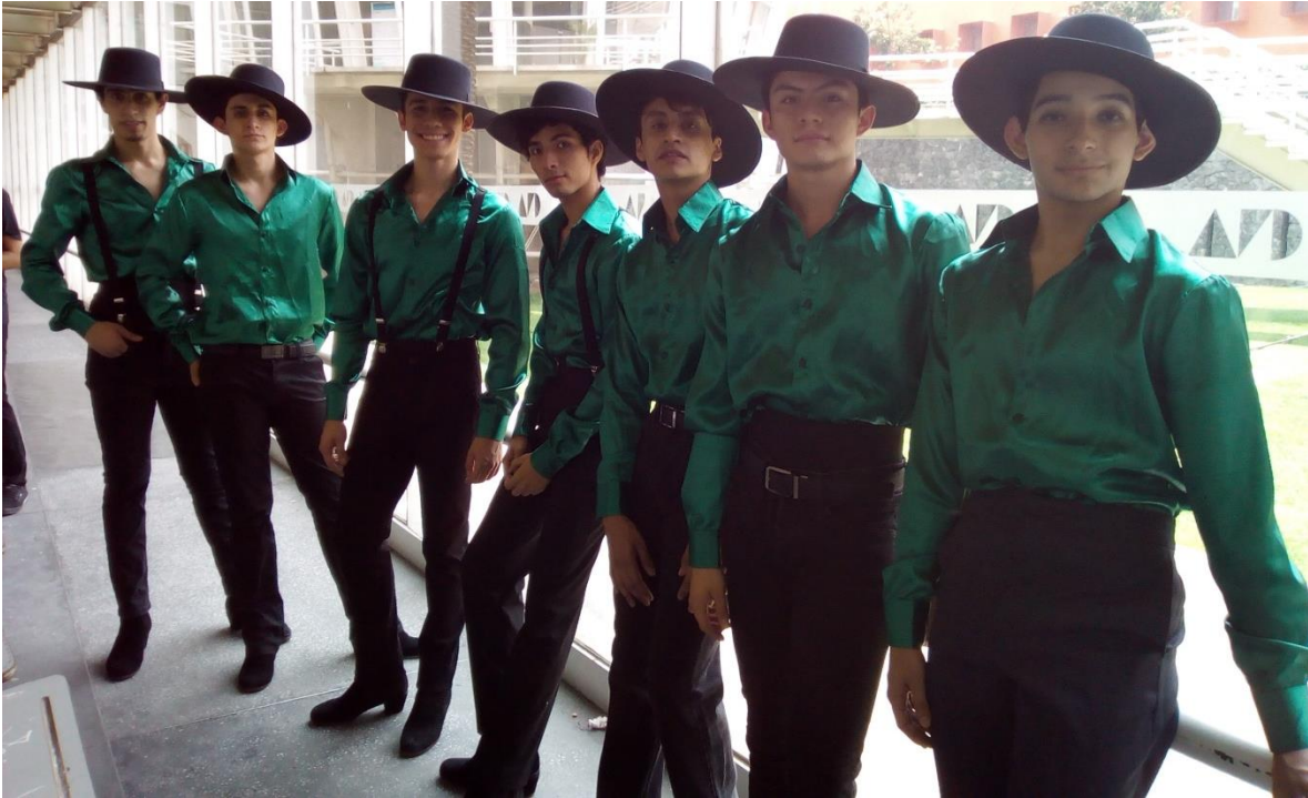
ENDCC. Alumnos preparados para función de Prácticas Educativas de la ENDNGC