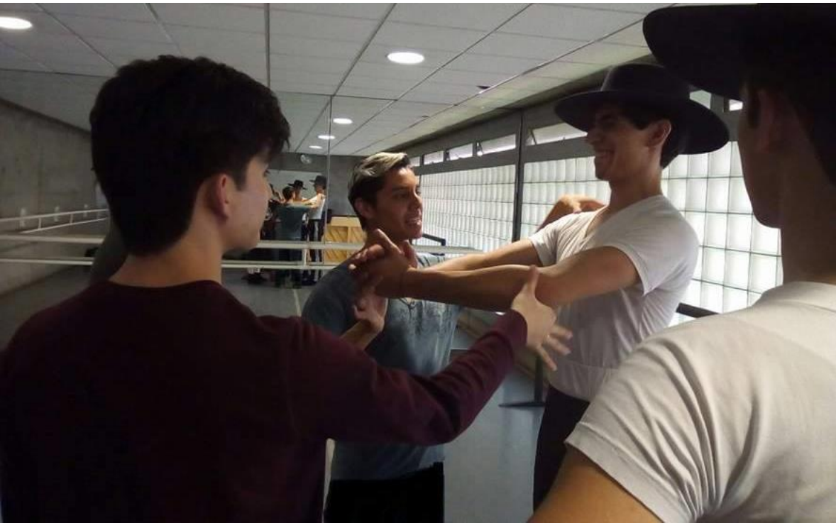
ENDCC. Clase de Danza Española: Colocación