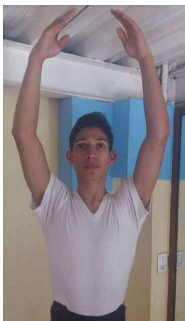
5° Posición Clásica