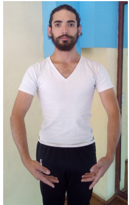
1° Posición Española