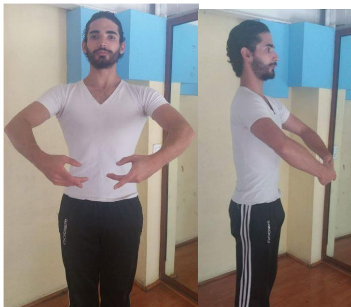
Posición Preparatoria Española