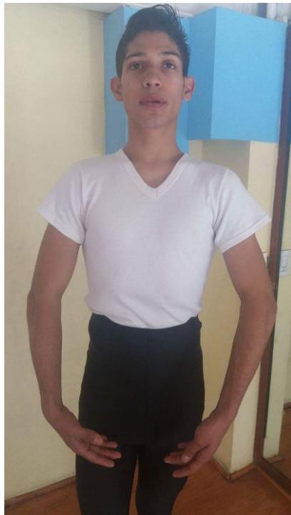
1° Posición Clásica