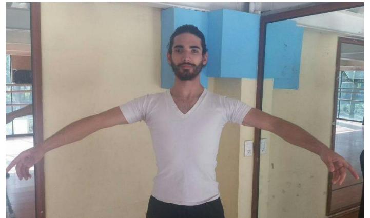
2° Posición Española