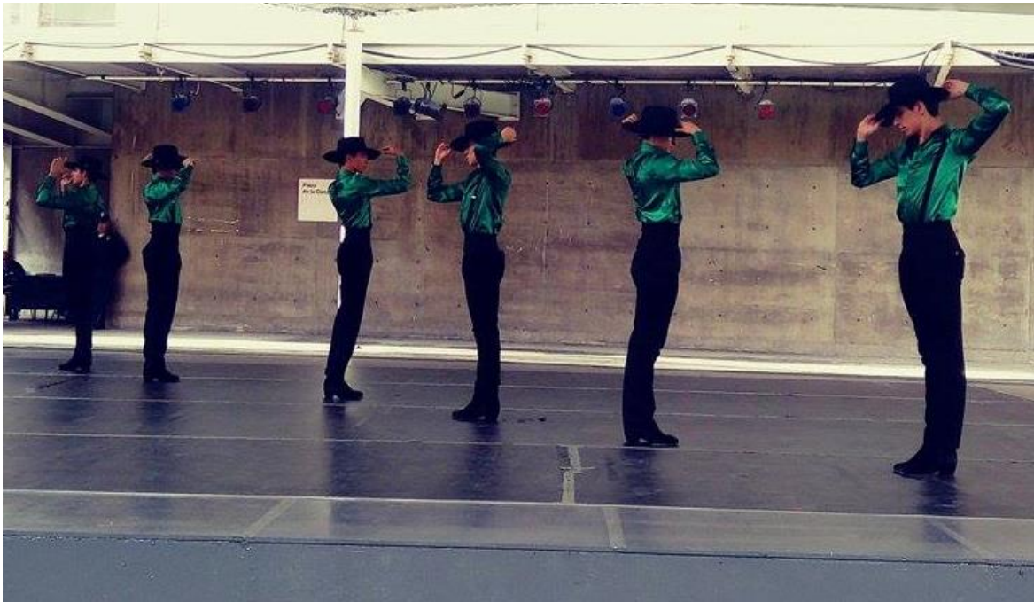
Plaza de la Danza. Función de Danzas a través de la Historia de la ENDCC.