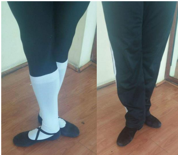
3° Posición Danza Clásica / Danza Española