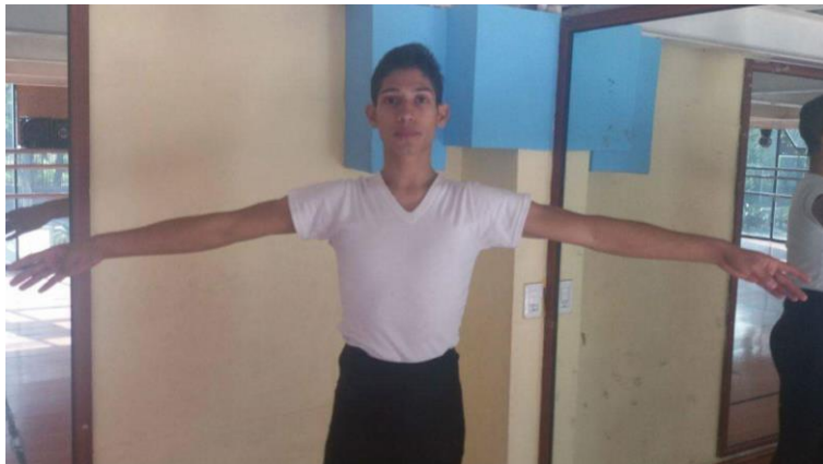
2° Posición Clásica