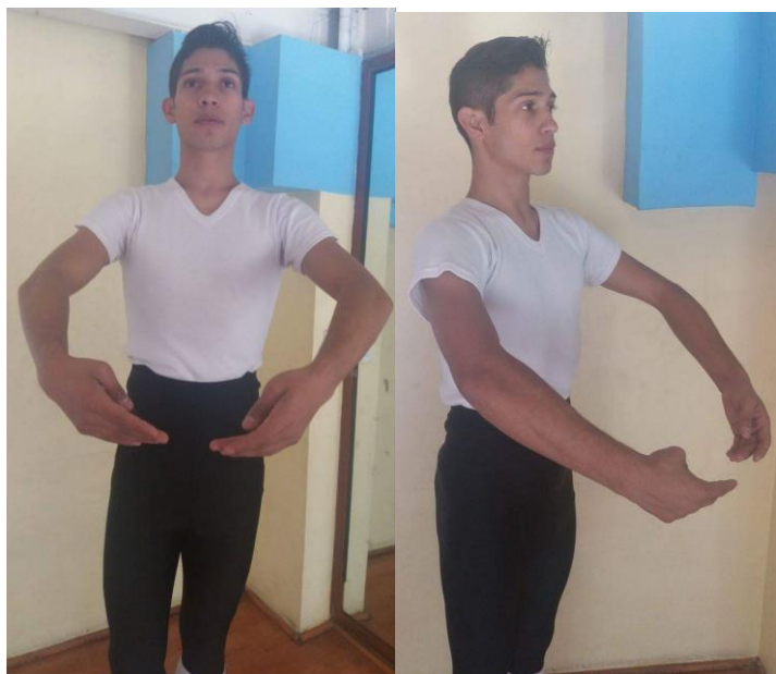
Posición Preparatoria Clásica