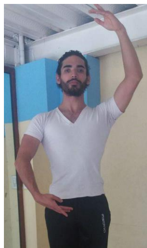
Cuarta Española Derecha