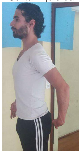
Octava Derecha (perfil)