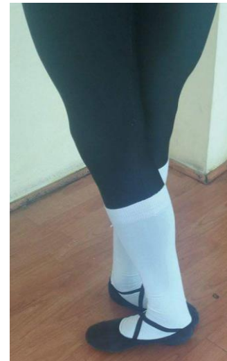
5° Posición Danza Clásica