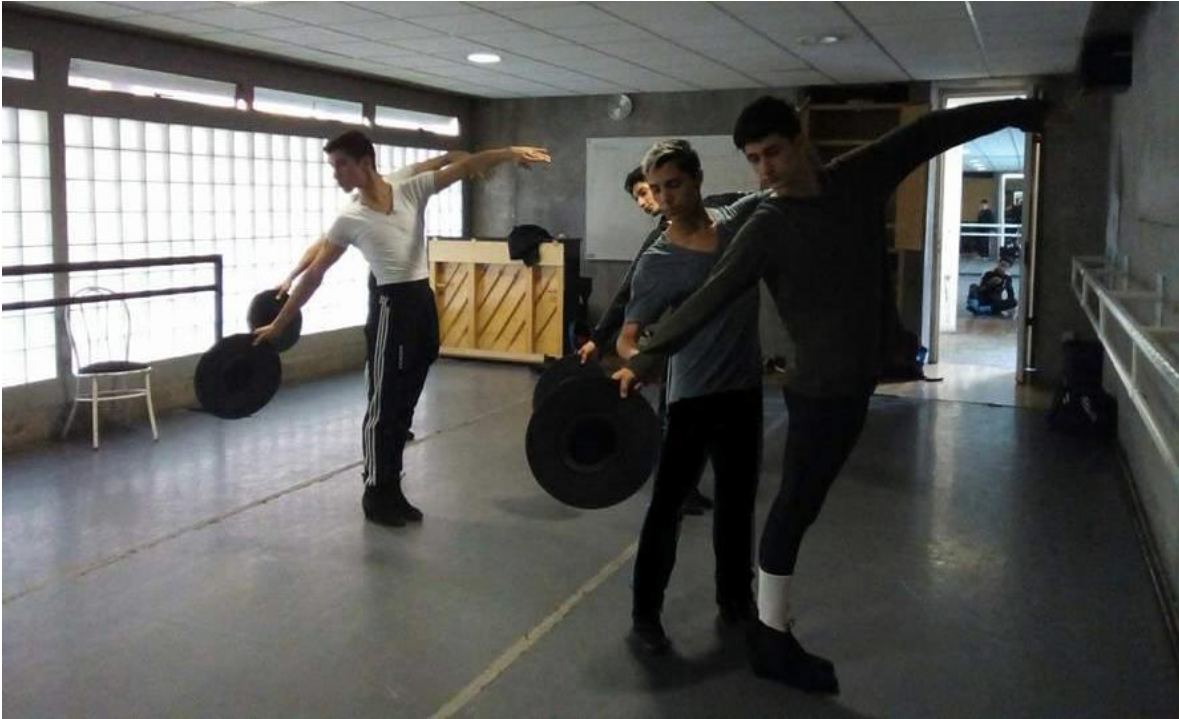
ENDCC. Clase de Danza Española: Técnica de Sombrero.