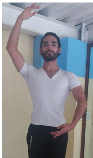
Cuarta Española Izquierda