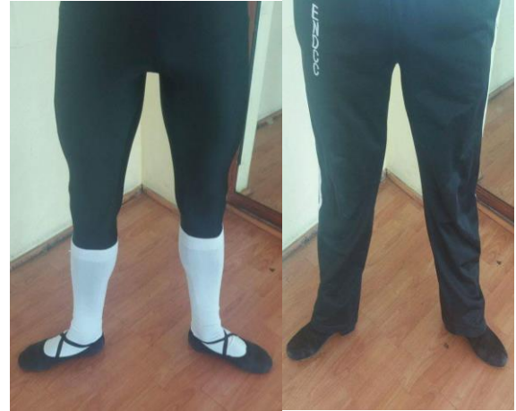
2° Posición Danza Clásica / Danza Española