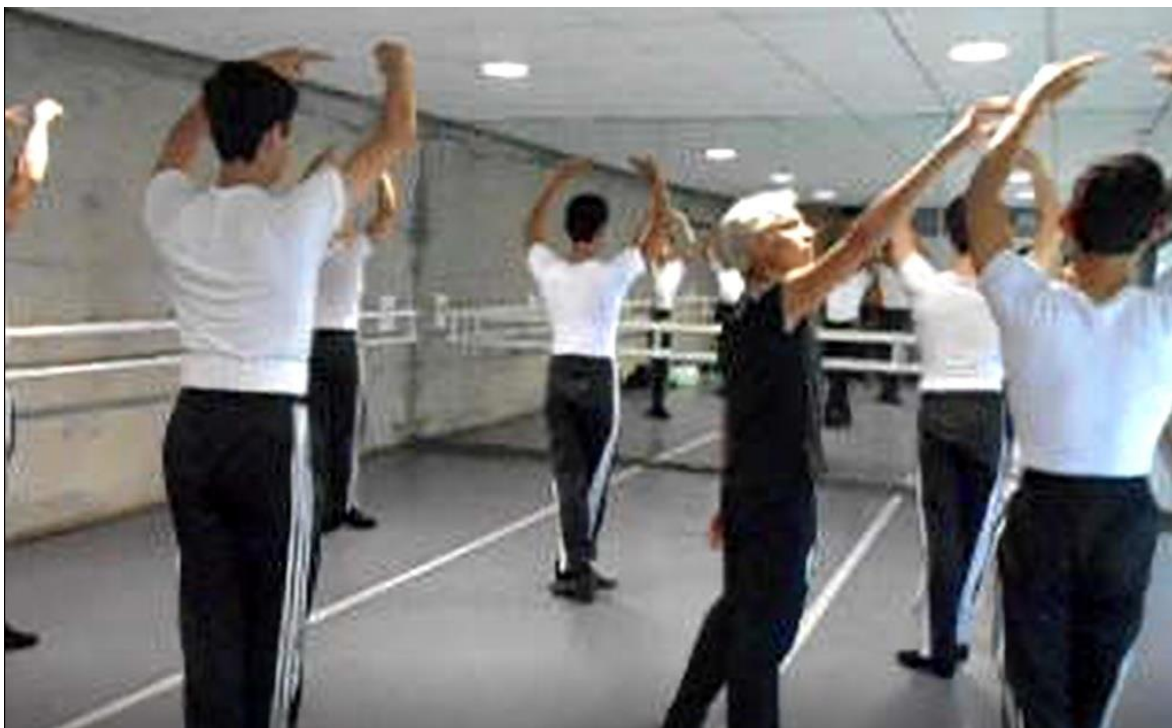
ENDCC. Clase de Danza Española: Colocación.