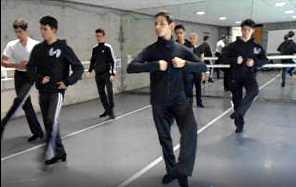
ENDCC. Clase de Danza Española: Pasos y Secuencias