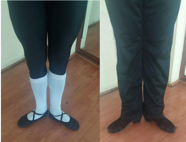
1° Posición Danza Clásica / Danza Española