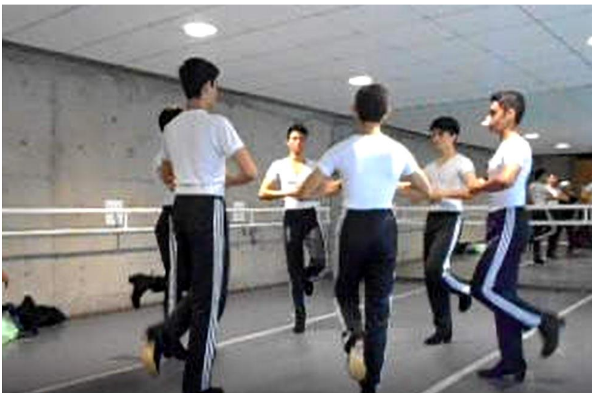
ENDCC. Clase de Danza Española: Zapateado