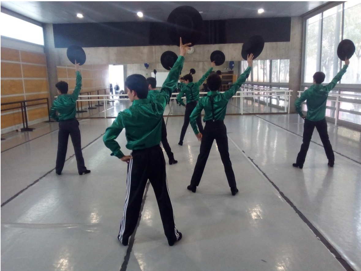
ENDCC. Ensayo del Montaje Coreográfico.