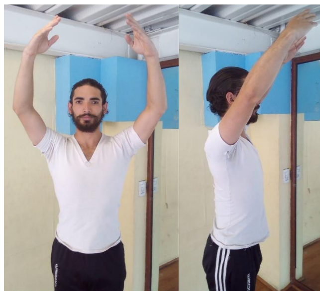
5° Posición Española