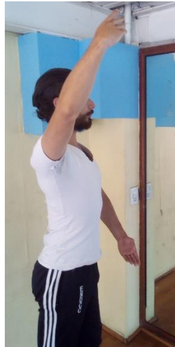
Cuarta Española Izquierda (perfil)