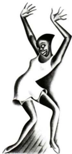
Tíralos abajo (mujer negra bailando), del libro Negro Drawings, de Miguel Covarrubias, 1927. Homenaje a Miguel Covarrubias, Fundación Televisa, Centro Cultural Arte Contemporáneo, México, 1987, p. 96

Su música era más provocadora que la de Wagner. Al oírla uno tenía que bailar con todo el cuerpo, con oscilaciones de la cabeza, castañetas o palmadas, pataleos y sacudidas. Era común ver en el jazz el gran “grito priápico” de la selva africana. La música trepidante del jazz arrancaba las máscaras de la censura moral: “los instintos más imperiosos se desencadenan, las almas civilizadas regresan a las selvas primitivas, en una especie de tregua a las convenciones sociales, y en los rostros sin máscara, más impúdicos por esa misma desnudez, puede leerse el ímpetu licencioso de los carnavales antiguos” (“La vida nocturna y los super cabarets”: 153). 359