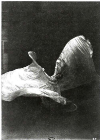
Loie Fuller bailando con su velo. Fotografía de Isaiah Taber, s. f. Loie Fuller. Danseuse de l'Art Nouveau . París, Éditions de la Réunion des musées nationaux, 2002, p. 119.

que caminaba sobre él todo el tiempo, y maquinalmente lo levantaba con ambas manos y con los brazos en lo alto, flotando, y así todo el tiempo iba revoloteando por el escenario como un espíritu alado. De repente alguien gritó: ¡Una mariposa! ¡Una mariposa! (Fuller, Goddess : 31, trad. mía).