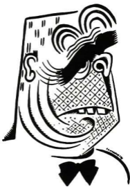
José Juan Tablada, caricatura de Miguel Covarrubias