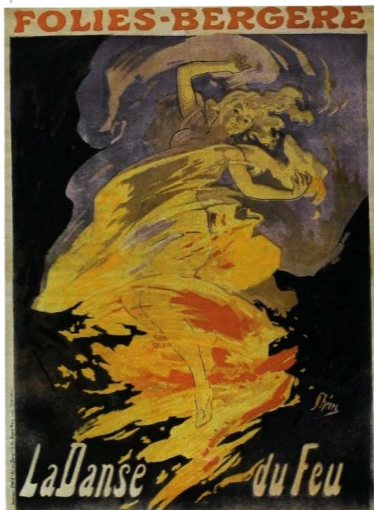
Loie Fuller en su Danza del fuego . Cartel de Jules Chéret para el Folies-Bergère, 1893. The Golden Age of the Poster , Nueva York, Dover Publications, 1971, p. 21.