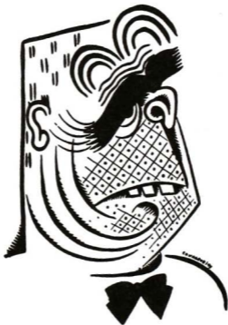
José Juan Tablada, caricatura de Miguel Covarrubias