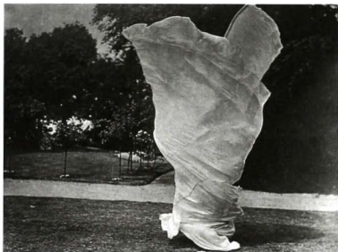
Loie Fuller envuelta en su velo.

El simbolismo debusiano es quizá la más perfecta traducción de ese mundo misterioso en perpetuo movimiento adivinado por el poeta en sus ecos lejanos y luego traducidos en palabras oscuras. Debussy logró en la música lo que antes el poeta Paul Verlaine pidió para el verso libre: libertad, flexibilidad y sobre todo música en el encuentro de armonías inusitadas (“Arte poético”). En el Preludio a la siesta de un fauno (1894), poema en prosa de Stéphane Mallarmé, o en el drama simbolista Peleas y Melisanda (1902) del belga Maurice Maeterlinck, el músico francés tradujo estos misterios en un lenguaje fluido y transparente. El simbolismo no era una poesía destinada al entendimiento sino a la imaginación. El espectador o el oyente no procuran entenderla, sino abandonarse a las sugerencias proporcionadas por su música, fundamental en este plan espiritual: “la música nos acerca al alma del mundo”, escribió Schopenhauer, filósofo para quien el símbolo era la operación irracional del entendimiento.