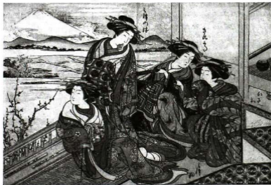
Women of the Óbishiya House of Pleasure (winter) . Grabado de Katsukawa Shunshó y Kitao Shigemasa. Timothy Clark, The Actor's Image. Print Makers of the Katsukawa School , Chicago, The Art Institute of Chicago, 1994, p. 221.

Reconocible por su rostro pintado de blanco, su boca diminuta y roja carmesí, un voluminoso lazo ( obi ) atado por atrás (por delante si era prostituta), que caía sobre el elegante kimono, la geisha era parangón de una sofisticación artística que compartían los poetas del fin de siglo. En su retrato influyeron los Bijin-ga (imágenes de hermosas mujeres) de Hokusai, de Toyokuni (1769-1825), y de Utamaro. Los Bijin-ga evocan un mundo de placeres efímeros, con un ideal de urbanidad ( akanuke ) y de impecable sentido artístico ( tsu ) encarnado por la cortesana y sus magníficos atavíos. Existe una convergencia interesante entre el mundo de artística sofisticación de la geisha japonesa y la retórica modernista. Ambos son estilos de la forma, unidos por una misma "acuidad sensitiva" superior. En su defensa de las islas de la belleza -y Japón era una de las últimas- Tablada y los modernistas encontraron en el arte japonés una sensibilidad artística similar a la suya, un valor más profundo y trascendente, no únicamente utilitario, y en la elegante geisha del Yoshiwara, la quintaesencia del Arte y del misterio.