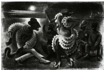
La rumba. Caribbean dance, the malecón, Havana, Cuba, 1928. Gouache de Miguel Covarrubias. Adriana Williams, Miguel Covarrubias , Austin, University of Texas Press, 1994.

[...] consciente de la angustia pasional que de su ser poseído irradia en el auditorio entero, parece gozarse en exaltarlo y volviendo las espaldas y mirando al público de soslayo, por encima del hombro, recorre todo el proscenio, pausada y lateralmente, mientras con ambas manos ciñe el tenue ropón a su cuerpo sacudido en rotundo contoneo y en alternativos regateos (“Bailes exóticos: La Rumba ”, 198).