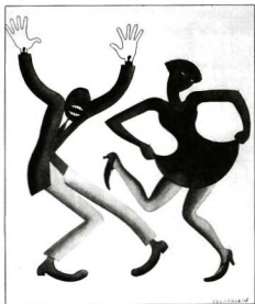
Double Charleston , del libro Negro Drawings , de Miguel Covarrubias, 1927. Sylvia Navarrete, Miguel Covarrubias, artista y explorador , México, Conaculta/Era, 1993.

ca" eran su antítesis: ("Las catedrales del júbilo": 111). A diferencia del antiguo Guñol con sus dandis y sus femmes fatales de ultratumba, el americano mostraba un vigor y un dinamismo sorprendentes. El cambio estaba influido por "esa endiablada y subversiva música del jazz que desquicia y anonada nuestros reparos y nos envuelve en sugestión gregaria y nos presta un alma de circunstancias, selvática, primitiva, negra" ("La vida nocturna y los super-cabarets": 155).