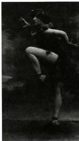
Colette bailando en el papel del fauno. Mimodrama El amor, el deseo y la quimera , 1906. Geneviève Dormann, Amoureuse Colette , París, Herscher, 1984, p. 147.

Mientras ejecutaba los primeros pasos de una danza de seducción, como todas las danzas aunque sean pastoriles, aunque sean hieráticas, puesto que todas ellas, bajo los paniers Watteau o la tiara de oro de las bayaderas animan y estilizan el supremo gesto de amor, sigo sobre el tablado la aligera carrera de sus pies, de estatua por la forma, pero vivos, desnudos, teñidos de bermellón en las uñas y los talones. Su corta melena de amante lesbiana, de Bylitis, de Mirtocleia, es de un rubio ceniciento y cae sobre su rostro, donde la boca es irónica y sensual, los ojos agrandados por el kóhol prolongan su comisura hacia las sienes con la larga