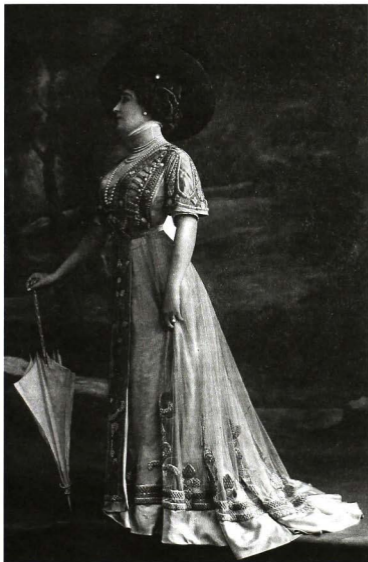
Carolina Otero, "la sirena del suicidio". Geneviève Dormann, Amoureuse Colette, París, Herscher, 1984, p. 79.