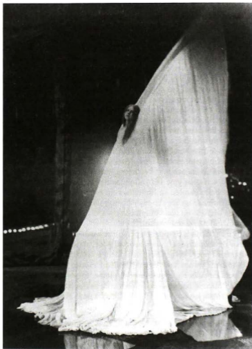
Loie Fuller posando en El arcángel . Fotografía de Eugène Druet, 1908. Loie Fuller. Danseuse de l'Art Nouveau . Paris, Éditions de la Réunion des musées nationaux, 2002, p. 139.