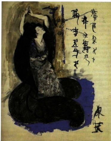
La bailarina Sada Yacco . 1901. Pablo Picasso. Acuarela y tiza negra, París, 1901. Picasso en Bogotá . Museo Nacional de Colombia, 2000, p. 67.