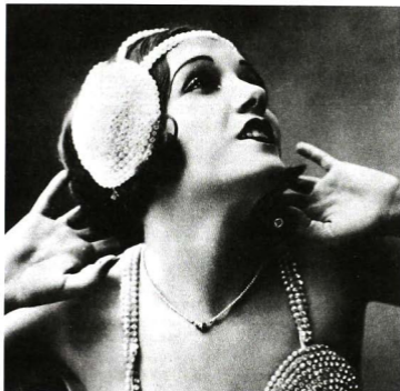
Lupe Vélez, "el ciclón mexicano". Alfonso Morales, Los recursos de la nostalgia. I. Memoria y olvido: imágenes de México , México, Cultura/SEP, 1982, p. 32.

tipo de belleza moderna agradablemente blasfematoria y refrescante. Al final mostró su preferencia por un arte con vida, emancipado de Baudelaire y de los polvos. En este sentido siguió fiel a la vocación iconoclasta del modernismo, un rasgo que heredó de sus días pasados entre artistas que cultivaron la tradición de la ruptura en su momento bajo distintas banderas. El modernista moderno aprovechará ambas tradiciones para fusionarlas. Es precisamente en este doble movimiento donde el imaginario modernista revela toda su enigmática complejidad y su modernidad. Modernidad cuyo rasgo predominante, escribió Octavio Paz, "es esta crítica, que se muerde la cola, que se devora a sí mismo, que pone en crisis sus propios fundamentos. El modernismo es moderno porque duda de sí mismo,