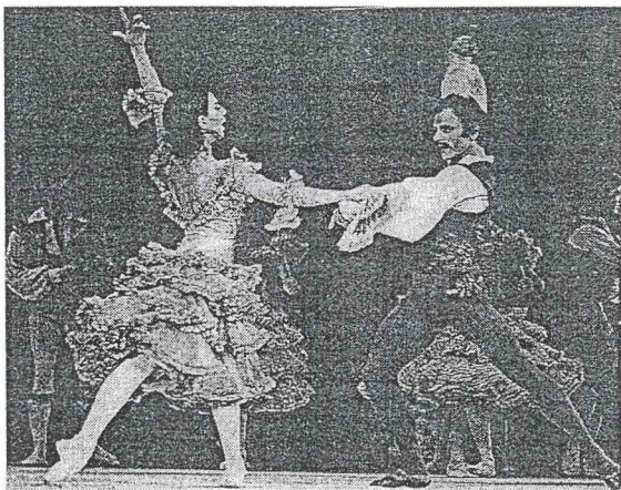
DON QUIJOTE: Otras producciones.