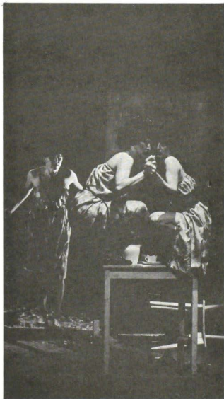
El Viaje, por El Cuerpo Mutable.

"El Cuerpo Mutable sigue mutante... Ahora ha creado Número suspensivos ... incorpora más que en ninguna otra obra elementos teatrales... Ahora este teatro danzado maneja inclusive el suspensio... Lo mutante se da en la transformación