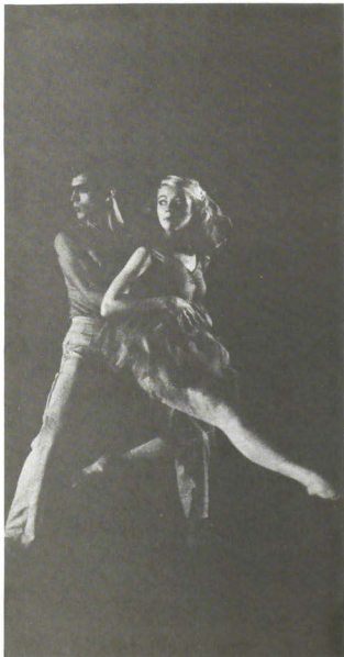
La gata y su huésped , con Quinto Sol.