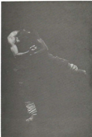
Vanguardia de un pueblo , de Cecilia Appleton.